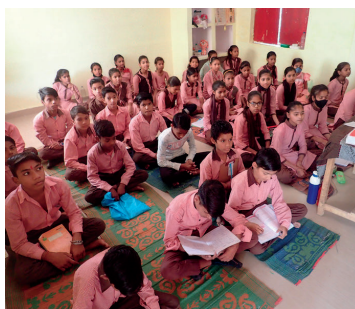
授業中の子供たち。机椅子がないので床に座りカバンを机代わりに授業を受ける。