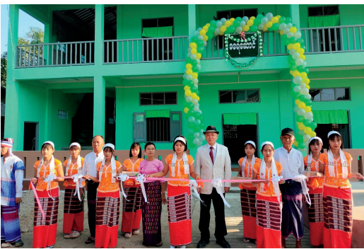
新校舎の前でのテープカット

この5月に私は、その1つであるペービンセンナ村での「落成式」に招待されました。なんの落成式かと言いますと、なんと彼らは自らの手でもう1つ校舎を建設してしまつたので、その「自立校舎」の落成式だったので。しかも、その校舎は立派な2階建てでした。