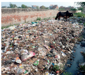
溜池に通じる道路は、ゴミの山で埋め尽くされている。

プロジェクト資金は外務省のNGO助成金に応募して獲得する予定です。3年前同じ助成金でチベット支援を行ないましたが、それは継続しながら、同時に一般のインド社会に対しても支援の手を広げようと思っています。外務省助成金では足りないことも多々ありますので、どうぞ会員の皆様厚いご支援をお願いいたします。