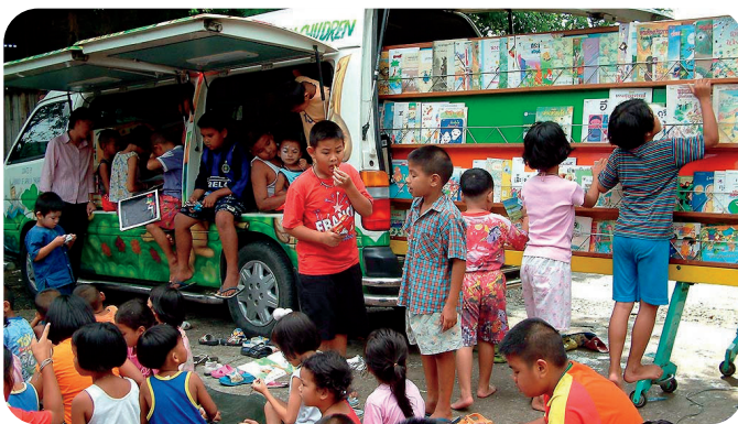
移動図書館を楽しむタイの子どもたち

SDGsのゴール7.「エネルギーをみんなにそしてクリーンに」という項目の、「すべての人々に手ごろで信頼でき、持続可能かつ近代的なエネルギーへのアクセスを確保する」という目標と重なります。