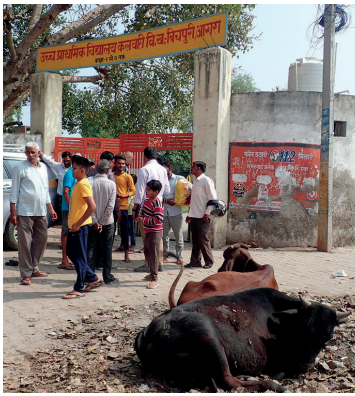
カラワリ小学校の正門前。道路に放置されたゴミを漁る牛。

町の下水は地区の外れにある直径約100メートルの溜池に流れ込みます。もちろん浄化槽などはなく、汚水はそのまま浸み込んで地下水となり、いくらか濾過されますが、住民はその地下水をポンプで揚水して飲み水にしているのです。