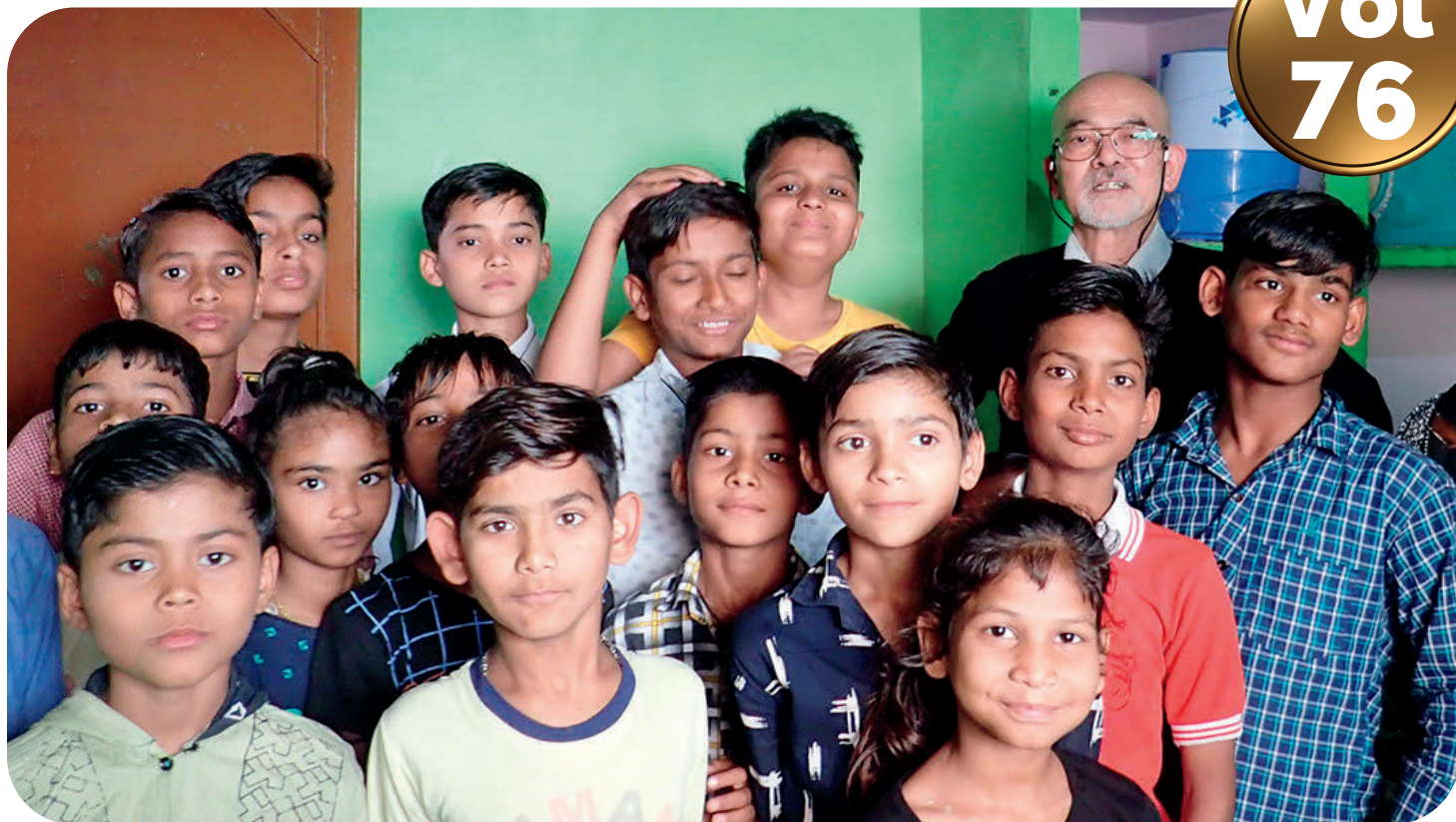
カラワリの子供たち。中学生たちだが、日本と比べ体格が小さい印象を受けた。