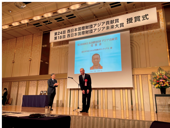
西日本財団アジア貢献賞 授賞式の様子

2012年からはマンマーに於いて、毎年ほぼ10校のペースで学校建設を行い、これまで累計113校（2023年6月現在）を建設しました。その中で特に大切に出来たのは、それぞれの町や村の人々が総建築費の4分の1相当を住民自ら集めてもらう事を学校建設の大前提とした事です。実はそのお金は学校建設には使わず、学校建設終了時に住民にお返しします。そして次のステップとして、その資金で様々な農村開発事業を村人自身で行ってもらうよう指導し、その収益金で学校を自らの手で維持・運営してもらいます。これによって村人達自身の手による自立した農村開発が始まったのです。