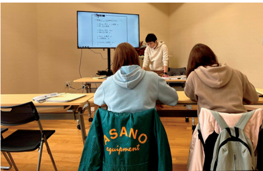
大人の日本語学習の様子

日本語の授業は専用の教科書を使っていますが、前述の彼女は毎時間きちんと教科書の予習を行い、新しい単語にはマーカーで線を引き、事前に授業で学ぶ単語も覚えてきています。また少しでも時間があれば、日本語の教科書を開いて勉強するなど、とても努力家で、中学校の先生たちも驚いています。