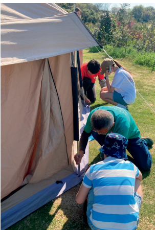
テントを張る子どもたち

当会は、避難民の来日直後から継続した日本語教育の提供を行っています。子どもたちに対しては、「NPO 法人・外国から来た子ども支援ネットワーク」と連携し日本語教育を提供していますが、大人に対しても、当会が日本語講師を雇用し、各々の進捗に合わせた授業を提供しています。皆さん徐々に日本語が話せるようになってきており、特に子どもたちの言語の習得の早さには驚かされます。