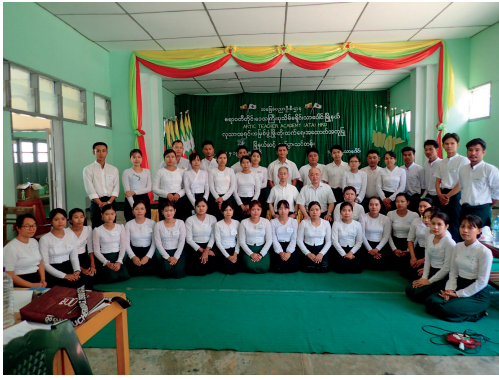
ターバウンで行われたATA